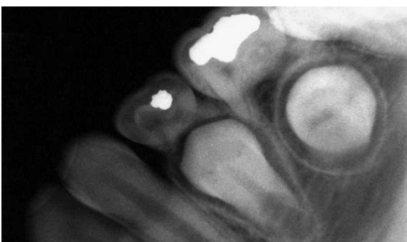
FIGURA 2 - Inclinação vestibulo-lingual da coroa do segundo pré-molar inferior direito.