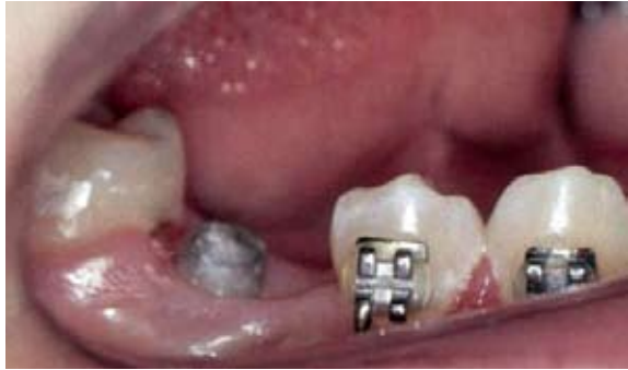
FIGURA 4 – Magneto parcialmente exposto na cavidade bucal.