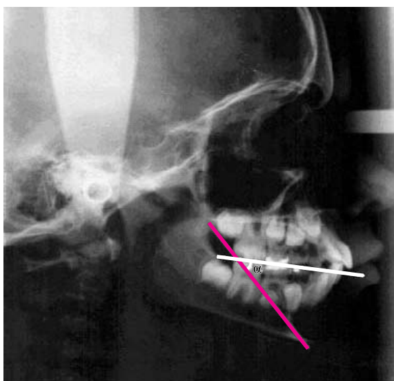
FIGURA 1B - Inclinação distal da coroa do segundo pré-molar inferior direito ( \alpha=42^\circ ).

dentária. No entanto, verificou-se a impaction do segundo pré-molar inferior direito junto à raiz mesial do primeiro molar inferior permanente direito (Fig. 1B), apresentando um estágio de rizogênese bastante atrasada. Verificou-se ainda uma inclinação coronária no sentido vestibulo lingual (Fig. 2). O dente em questão posicionava-se inclinado em relação ao plano oclusal em 42^\circ , conforme averiguação feita na radiografia cefalométrica (Fig.1B).