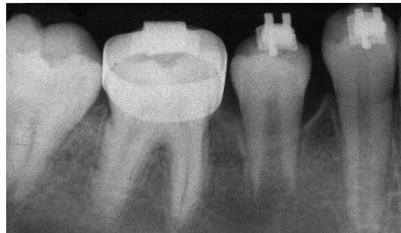
FIGURA 8 – Radiografia feita 4 meses após a desimpactação.