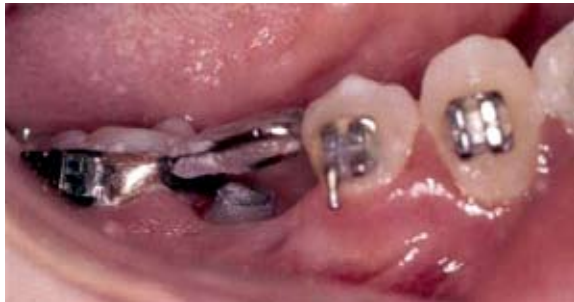
FIGURA 5 - Sistema banda-alça com o pólo magnético incrustado em seu interior.