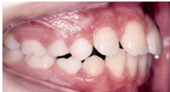
FIGURA 1A- Aspectos clínicos iniciais.

As radiografias periapicais, ortopantomáticas e a teleradiografia em norma lateral ratificaram a normalidade das bases ósseas, bem como a morfologia