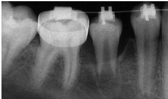
FIGURA 7 – Radiografia feita 40 dias após a desimpactação. Emprego de fio NiTi 012, para manter o dente alinhado e estável no arco.

Não obstante, para o êxito desta nova proposta