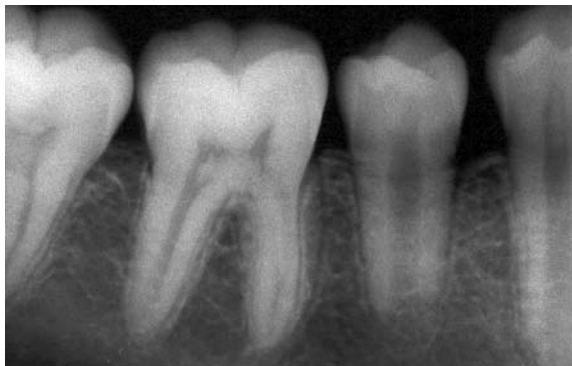
FIGURA 9A – Radiografia feita 8 meses após a desimpactação. Convém salientar a boa implantação óssea e a rizogênese em evolução.