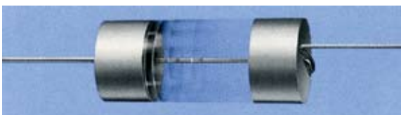
FIGURA 3 - Magnetos terra raras da liga samário-cobalto ( \text{Sm}_2\text{Co}_{17} ).