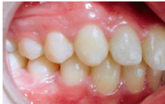
FIGURA 9B – Resultado final, um ano e meio após o procedimento. Vista lateral direita.